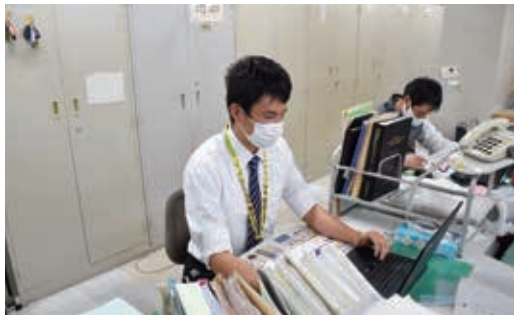
今年から社会人として仕事にも励んでいます

こぎがパワフルだったり、テクニックがあったりする外国人選手を見て、自分にはないものを持っている、人それぞれのこぎ方があると気付きました。その中で自分がどう戦うか考えるのは、とても楽しかったです。そして、国が違ってもカヌーに精いっぱい向き合っているのは、みんな同じだと思いました。