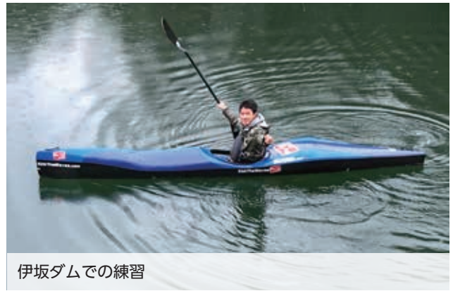
伊坂ダムでの練習