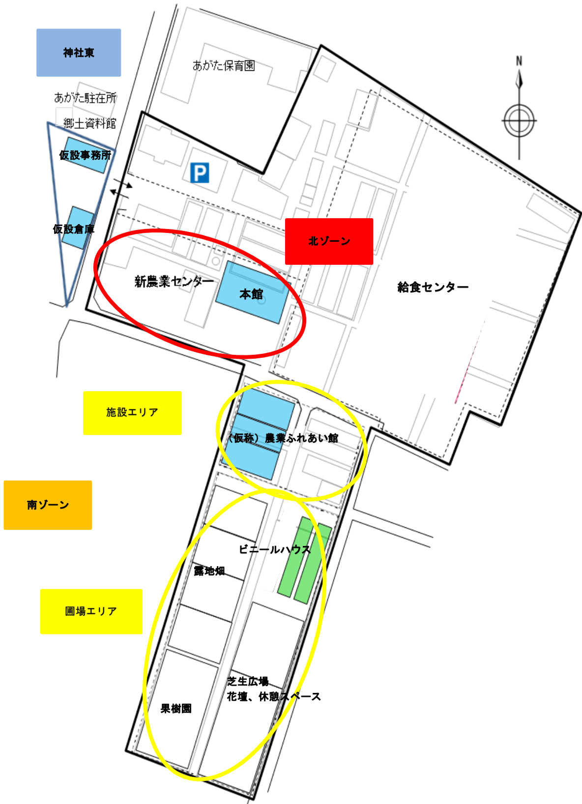
レイアウトイメージ図