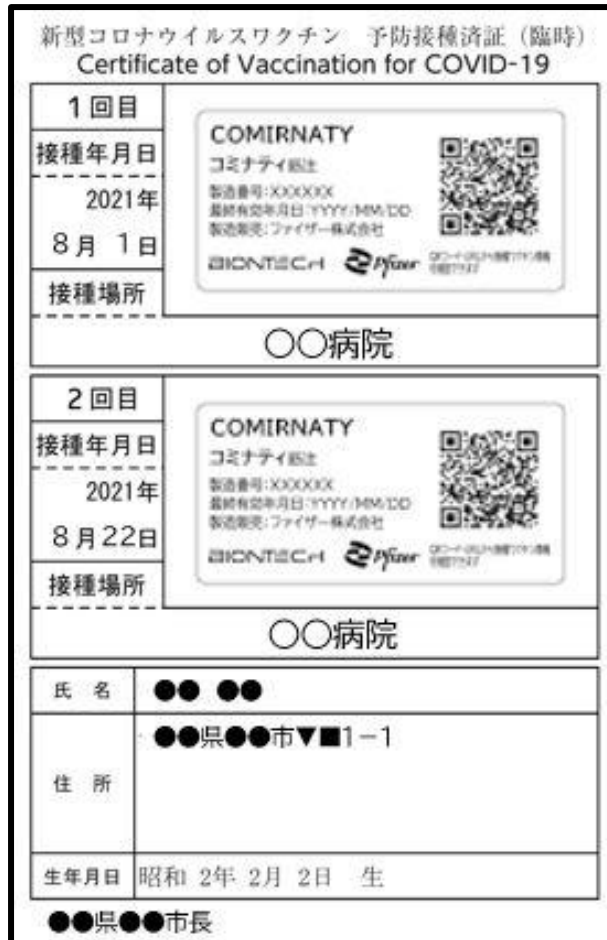
(1・2回目)予防接種済証