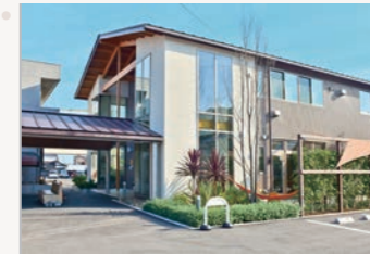
▲シェルームの外観

市内北部にはひばりルーム、中央にはカンガルーム、西部にはチェリーケア、南部にはシェルームというように市内各所に病児保育室が設置され、利用者にとって便利な施設を選択できるようになりました。