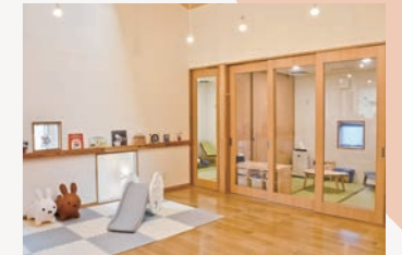
▲シェルームの保育室 病状別に部屋を分けています

貝沼内科小児科では、SDGs (持続可能な開発目標) の趣旨に賛同し、住み続けられるまちづくりに貢献できると考え、働く保護者をサポートする取り組みとして、病児保育室を開室しました。今の社会では、核家族化などを背景とした世代間の交流が減少しているのも、自宅療養が難しくなっている要因と言えます。体調が悪い時は、お子さんが一番安心できる環境で療養することがいいと思いますが、それが難しい時には病児保育室が、ご家庭にとってレスキューの場となればと思っています。今は、入室前の診察で新型コロナウイルスなどの抗原検査も実施し、お預かりできるかを判断しています。お子さん、保護者が安心してご利用いただける環境を準備しています。