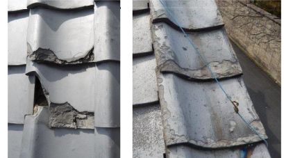
瓦が著しく破損している例