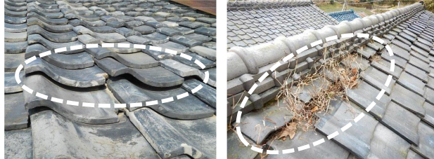
瓦に浮き上がりが生じている