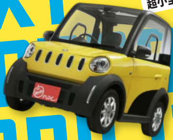
超小型電気自動車