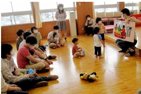
○子どもと親子の活動・交流の様子 (こども子育て交流プラザ)

【基本目標1—基本施策(2)—推進施策「(2)子育ての負担・不安・孤立感を和らげる相談事業の充実」関係】