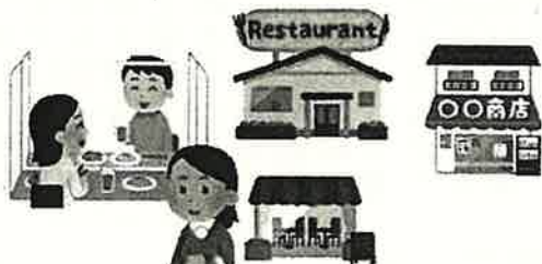
新しい生活様式に対応

るように設定する予定です。なお、中小店舗の基準は、大規模売場立地法に基づき売場面積1千㎡以下となります。予定する販売総額は7億円で、同商品券の購入方法は、クレジットカードやコンビニエンスストアでの支払いが予定されています。また、店舗側に対する募集は2月上旬に開始され、同制度に対する説明会やコールセンターを設置するなど、きめ細かいサポートを行っていきます。