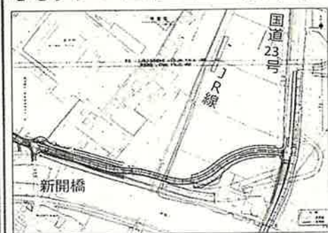
早期の計画実行が望まれる

生活道路には、国道23号の渋滞を回避しようとする通抜けの自動車が多く、住民にとって非常に危険な状況です。当道路が開通すれば、この抜け道解消となると期待されています。しかし、同計画の着手時期は未定で、早期の実行が望まれるところと見られます。