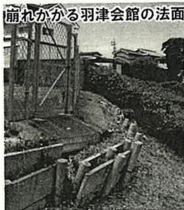
崩れかかる羽津会館の法面

自治会等が後押しすることが求められます。また、子供の事故回避能力向上のため、バス等大型車の死角体験教室等も実施していくべきです。