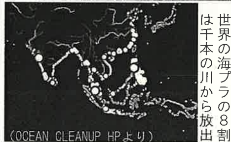
豪雨で河口に漂着した大量のプラスチック

生活バスよっかいち支援 市は、羽津地区を中心にコミュニティバスを運行する「生活バスよっかいち」に対して支援する補正予算案が上程されて、全員一致にて可決されました。感染症の感染拡大を受けたことで発出がされたまん延防止等重点措置等により、外出自粛要請があったにも拘らず、またもや国や県による交通事業者への支援からは「生活バス」が対象外とされています。しかし、「生活バス」はこれまで市の公共交通を支えてきた貴重な存在であるため、今回は市単独での支援を行う措置が取られた次第です。