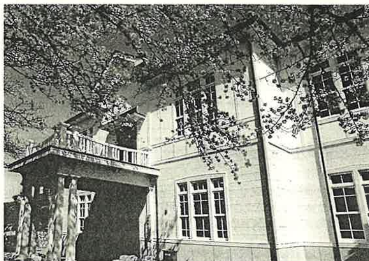
旧四郷村役場（四郷郷土資料館）