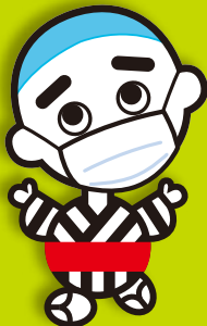
こにゅうどうくん