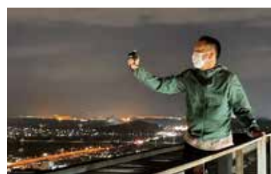
ビルの上からロケ地の下調べ

3月放送のCTY-FM「よっかいち わいわい人探訪」(3月12日、26日 8:54/14:54) でも紹介します。