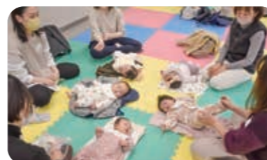
5・6組の親子でグループ分けします

子育ての仲間づくりを目的として、保護者同士でのおしゃべりを楽しんでいただいております。参加者からは、「月齢の近い子の保護者といろいろな話ができて育児の参考になった」、「悩みを共有できてよかった」、「気分転換になった」などの声をいただいております。ぜひ一度、パンダひろばに参加してください。