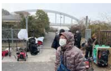
雪の日の映画撮影立ち合い