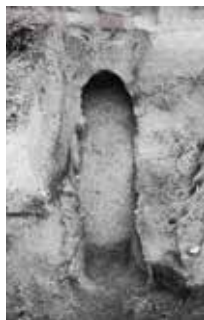
発掘調査で見つかった窯跡

奈良～平安時代には須恵器の器のほか、瓦塔（寺院の塔を模したもの）、平安時代末には山茶碗（無釉陶器）と呼ばれる製品が作られ、それぞれの時代の技術的な特徴がみられます。