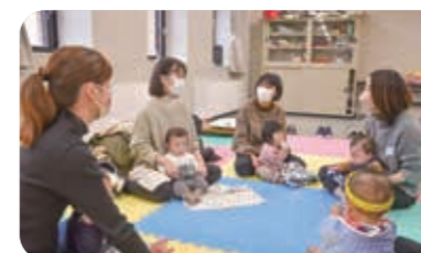
話題は離乳食や保育園、きょうだいのことなど