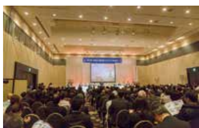
平成29年全国工場夜景サミットin四日市

いろいろなことに挑戦し、四日市の魅力を市内外に発信し、四日市好きを一人でも増やしていきたいと思います。