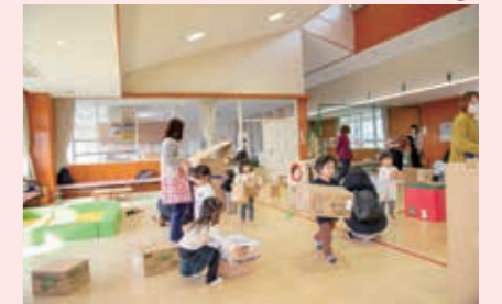
天井の高いホールでは各種イベントを開催

対 18歳までの子どもと子育てに興味がある人 時 9:00～19:00（小学生以下のみでの利用は17:00まで） 所 橋北交流会館4階 問 こども子育て交流プラザ ☎ 330-5020