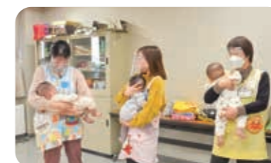
ぐずりしたらスタッフが抱っこすることも