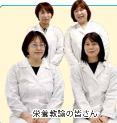
栄養教諭の皆さん

私たち栄養教諭が成長期の中学生にふさわしい栄養バランスの整った「からだにおいしい」献立を作成します。生徒の皆さんの意見も聞き、新たな献立の開発にも積極的に取り組んでいきます。