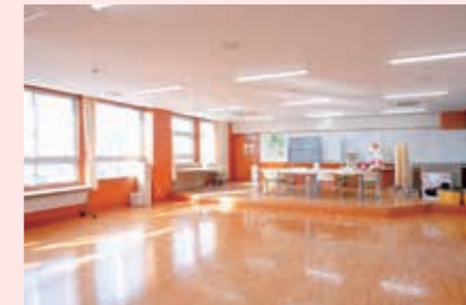
交流室では音楽イベントなどを開催