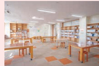
自習ができる図書室

こども子育て交流プラザは、児童館機能と子育て支援機能を併せ持つ施設で、図書室で自習したり、広い多目的ホールでのびのびと遊んだりすることができます。