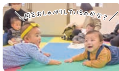
赤ちゃん同士の触れ合いも