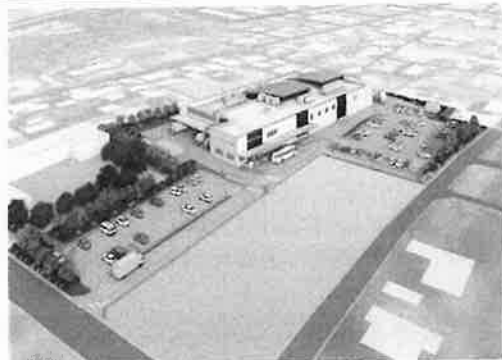
R5年供用開始予定の給食センターイメージ ※画像はイメージです。実際とは異なる場合があります。