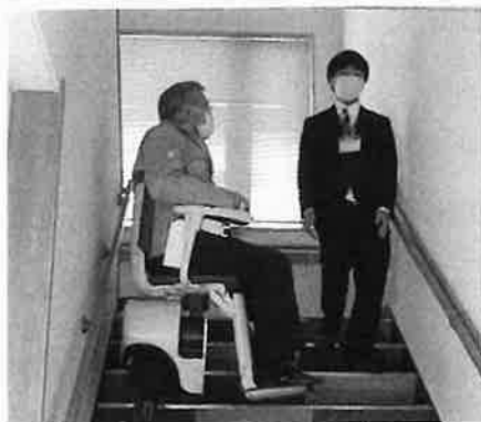
市民センターに設置予定の階段昇降機