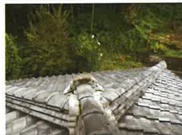
【老朽化した屋根瓦は危】

瓦屋根の改修補助は、今年からスタートしていますが、来年度以降予算を増額し、多くの方が活用できるようにして頂きます。