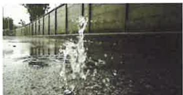
【マンホールからの吹き出し】