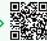
受講申込フォーム

https://logoform.jp/f/iPL7y 必要事項を入力し送信してください。