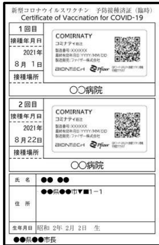
(1・2回目) 予防接種済証