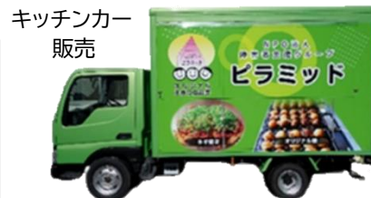
キッチンカー販売