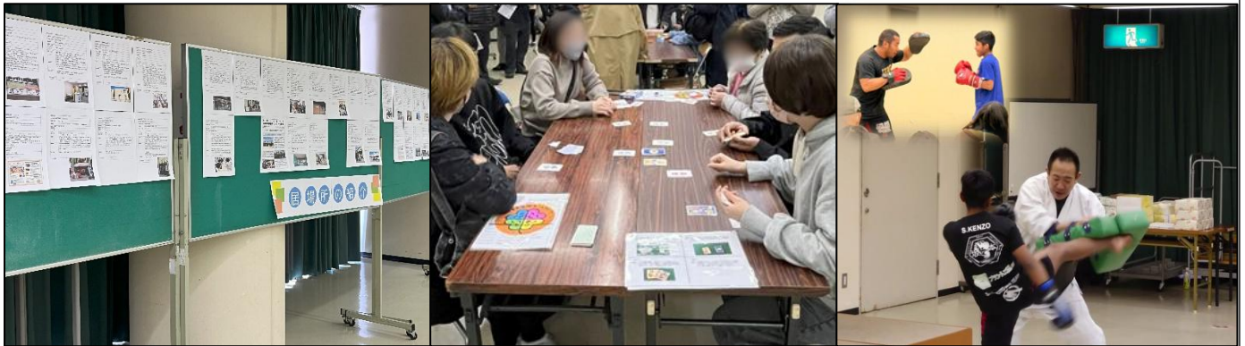
写真は昨年度の四日市居場所交流会の様子です