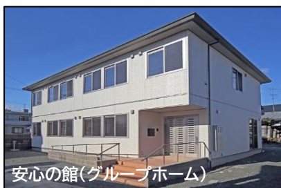
安心の館(グループホーム)