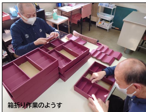
箱折り作業のようす

「障害があっても自立した生活を送るため、あいさつはきちんと出来るようにしています。」と支援員さんがおっしゃっていたように、皆さん「こんにちは」「ありがとうございました」と元気よくあいさつをしてくれました。障害があるこどもの親御さんから「親亡き後が心配」とよく聞きます。ピラミッドでは、親御さんの思いに応えるべく、あたり前の生活を安心して送るための雇用の場と必要なサービスを提供しています。