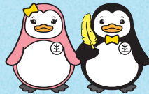
更生ペンギンの サラちゃん 更生ペンギンの ホゴちゃん

すべての国民が、犯罪や非行の防止と 犯罪や非行をした人たちの更生について理解を深め、 それぞれの立場において力を合わせ、 新たな被害者も加害者も生まない 安全で安心な明るい地域社会を 築くための全国的な活動です。