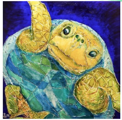
ゆかいなヒメウミガメ