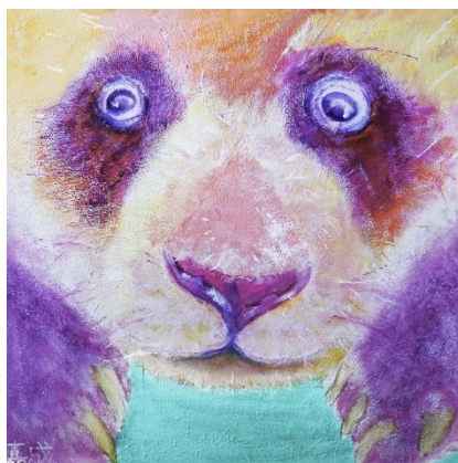
日なたぼっこをしているパンダ