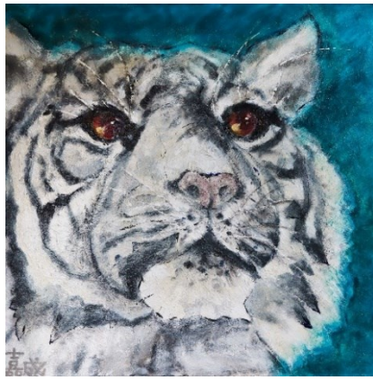
ホワイトタイガー