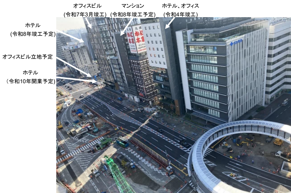
円形デッキ周辺の工事状況