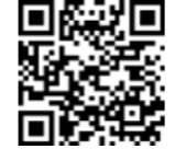
受講申込フォーム