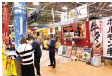
肉祭 in 四日市けいりん