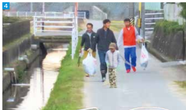
1 2月15日の「八郷早春まつり」でのコマ。昨年の「八郷フェスタ」が雨天で中止になったため、開催された 3 令和6年開催の「八郷フェスタ」 4 クリーンアップ八郷 5 地区行事でふるまう「八郷汁」。使われる野菜の一部やお米は、絆づくり事業の農作業体験に参加した親子が育てたもの