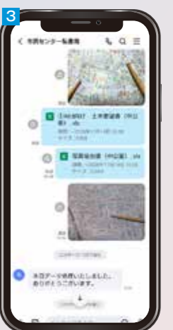
1 2 電子回覧板を導入し、自治会活動のデジタル化を先駆けている豊川市を視察。説明会が開かれた 3 地区市民センターとのLINE WORKSでのやり取り