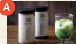
A 濃い抹茶グリーンティ(無糖) (南萩村製茶)

回答者の中から抽選で各3人に「洒水十貨店」が当たります。当選者の発表は、賞品の発送をもってかえさせていただきます。