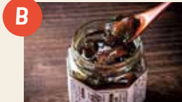
B ゴロゴロ椎茸入りあおさのり佃煮 ホープシード(株)

本市の特産品「かぶせ茶」を「抹茶」に仕上げました。抹茶として飲むだけでなく、お菓子作りにも使用できるなど本格的な味を手軽に楽しめるよう工夫を凝らした逸品です。