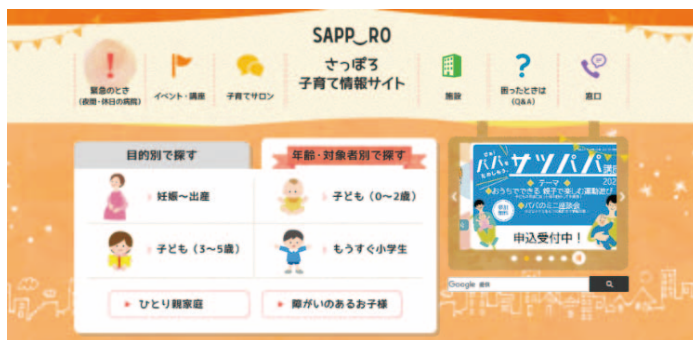
参考事例：さっぽろ子育て情報ホームページ

こども・子育て情報を集約したWEBサイトを制作し、体験・イベントや悩みの相談窓口などの情報を効果的に発信するとともに、こどもの権利などをはじめ「こどもまんなか社会」の実現に向けた周知啓発を行います。