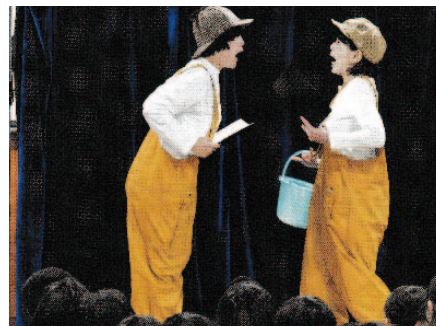
演劇表現による次世代育成事業