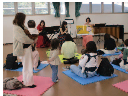
乳幼児期の芸術文化体験事業

こどもの感性のかん養と多様な自己表現につなげるため、プロの役者などによる学校訪問を行い、こどもに演劇表現を通じた体験と交流の機会を提供します。