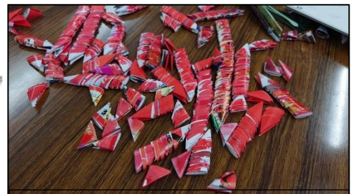
三角パーツをたくさん作ります