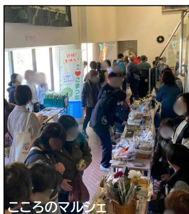
こころのマルシェ

精神障害がある人は、地域の中で孤立しがちになります。地域で自分らしく生活していくためには、地域の理解と協力が大切です。