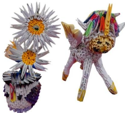
片手だけでも作品を作ることができます