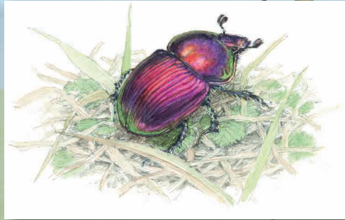
「うんこ虫を追い」原画 作・絵 館野鴻(福音館書店)