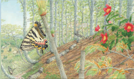
「ぎふちょう」原画 作・絵 館野鴻(偕成社)

たくさんの昆虫標本、昆虫ロボット、昆虫クイズ、 絵本作家・画家「 たてのひろし 館野鴻」さんの原画などが、 この夏 四日市にやってくる！ みんなで昆虫の世界にレッツゴー！