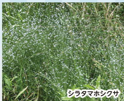
シラタマホシクサ