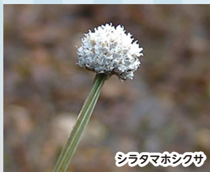
シラタマホシクサ