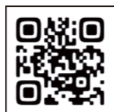
▲X (旧 Twitter)