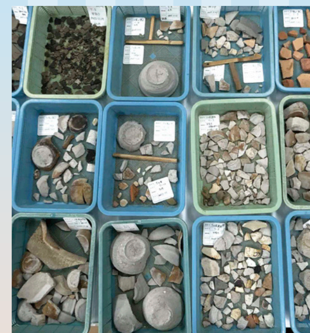
▲下之宮遺跡の試掘調査の出土品